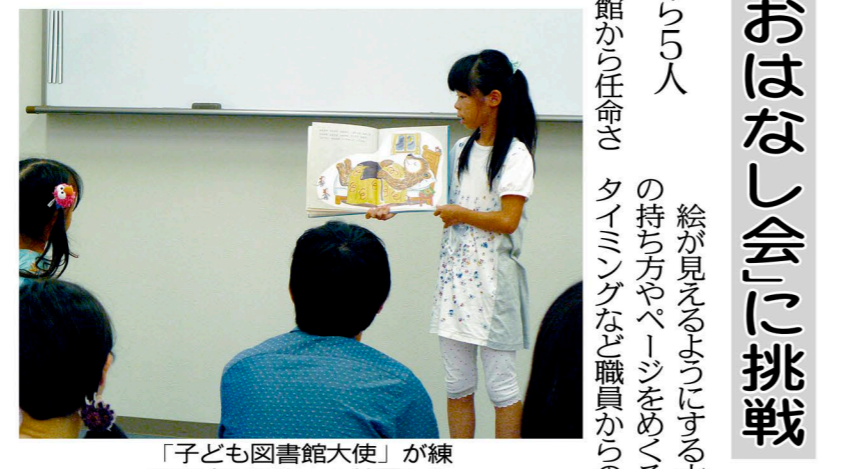
「子ども図書館大使」が練習の成果を次々と披露した

志段味図書館の小学生ららら 業務体験を通して図書館 の魅力などを学校の友達に 伝える小学生ら「子ども図 書館大使」が先月三十一 日、志段味図書館「深沢」 で絵本の読み聞かせ「お はなし会」を開いた。