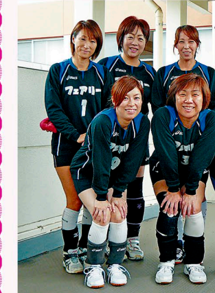
「フェアリー」ルビーリーグ出場メンバー

新しい体制を試してみたい 西小体育館に集まって練習、育児や仕事に限られた時間のやりくりをしながらかましている。中日デイアアラレクパレ