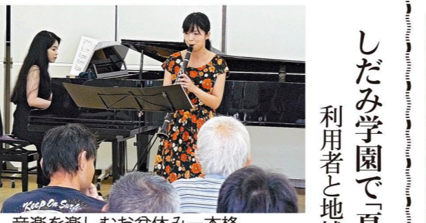
音楽を楽しむお盆休み一本格的な演奏が繰り広げられた

お店のオープン、セール、求人など チラシ折込 効果的な折込みのご案内いたします! 中日総合サービス 本社 052-261-2201 FAX 052-261-2220 守山支店 052-758-0352 FAX 052-758-0353 https://chunichi.nagoya/