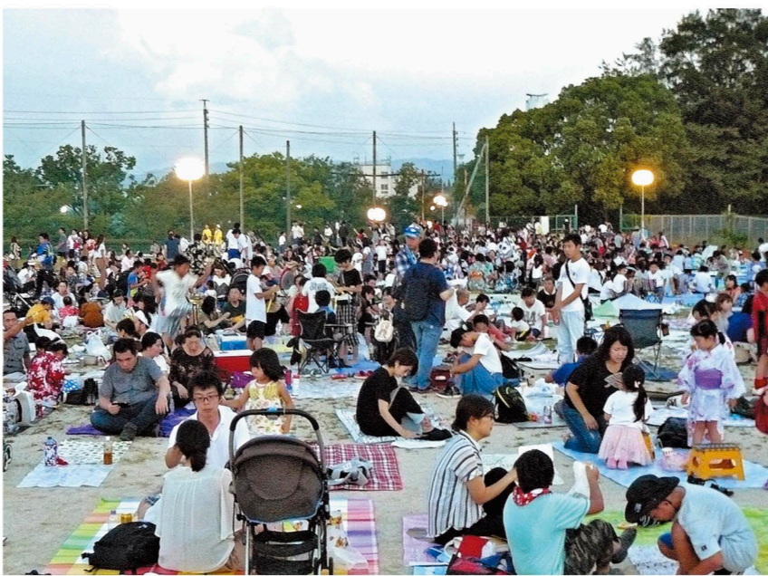
まだかな...花火の打ち上げを待つ人たちがいっぱい