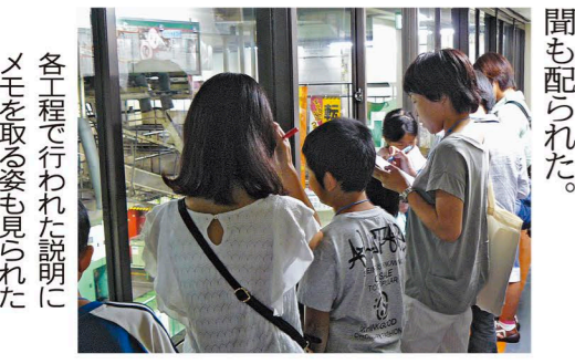
各で行われた説明にメモを取る姿も見られた