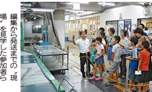
編集から発送までの現場を見学した参加者ら

中日新聞守山販売店連合会で行く「守山サークル」は先月二十一日、新聞社の見学ツアーを開いた。小学生と保護者ら四十人が中日新聞本社「中区三の丸」を訪れ、新聞ができるまでの過程を学んだ。 参加者は、「取材から各家庭に届くまで」をDVDで予習した後、専用コースを歩いて見学。ガイド役の社員とともに編集局や印刷部などを巡り、「印刷機の長さは七十五センチ」の説明には驚きの表情を見せた。 社会部記者も登場し、仕事で何をしているのか、質疑応答も行われ、「取材で気を付けていること」や「大変だった取材」な