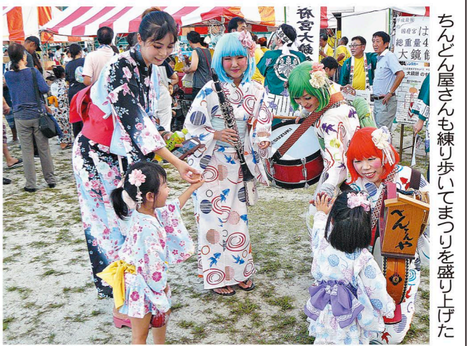
ちんどん屋さんも練習してまつりを盛り上げた