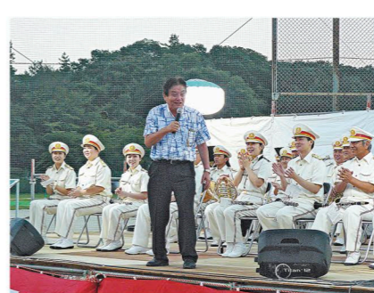
開会式であいさつをする長縄会長